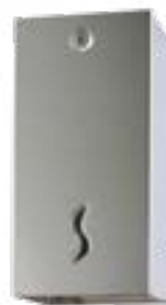
2 rotoli standard