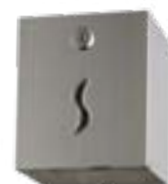
1 rotolo standard