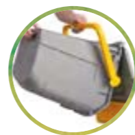
Prise de vidange