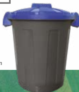
GRIS - BLEU Ref. 720205