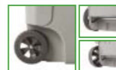
Roues et essieux pré-assemblés