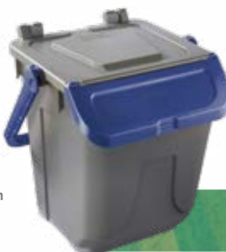
GRIS - BLEU Ref. 720105