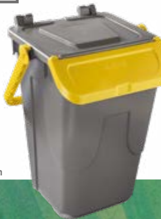
GRIS - BLEU Ref. 720115