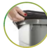
4 ganci fermasacco