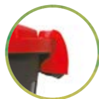
Chiusura a clip