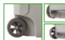
Ruote e assali premontati